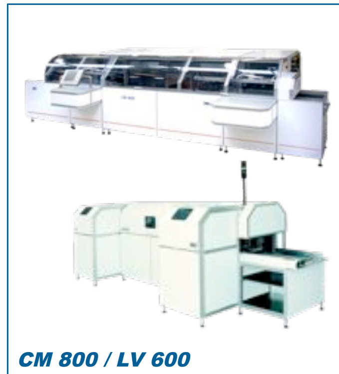
CM 800 / LV 600

IBL offers high performance inline machines for high board throughput. It is suitable for integration in every production line loaded directly from pick & place equipment. Automatic adjustment of the carrier rails facilitates easy product change. Multi-line loading of the carrier results in high board throughput rates. Depending on loading, a cycle time of less than 20 seconds per subassemblies can be achieved.