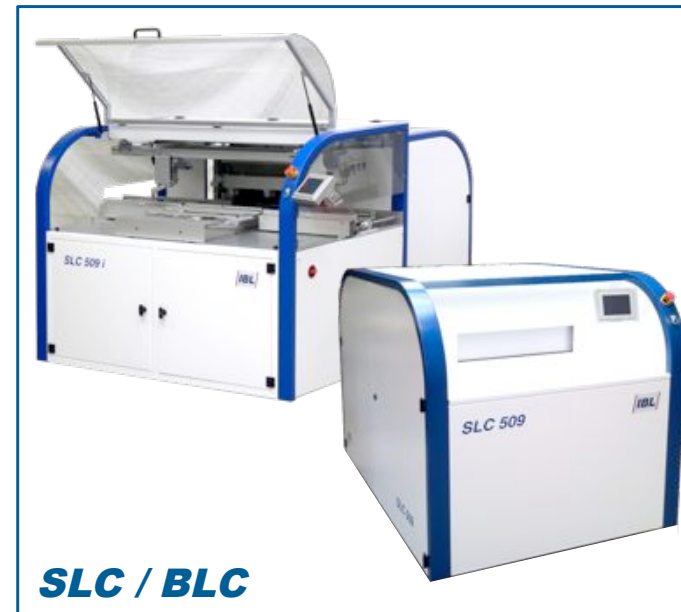
SLC / BLC

The Premium-Series has been designed for any type of soldering demand. Additional features as Soft Vapour Phase (SVP), Rapid Cooling System (RCS) and IR- heater (optional) increase the flexibility and scope of the machines. All batch machines can be upgraded to fully automated in-line production and can be loaded directly from pick & place equipment in the production line. It is possible to multi-load the carrier. The Premium-Series is available throughout the range of machines, from small to high volume production.