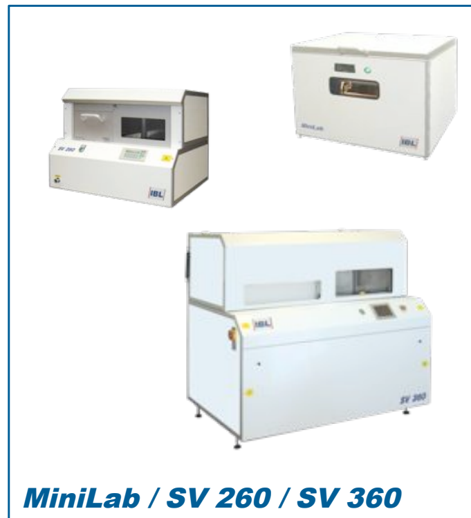
MiniLab / SV 260 / SV 360