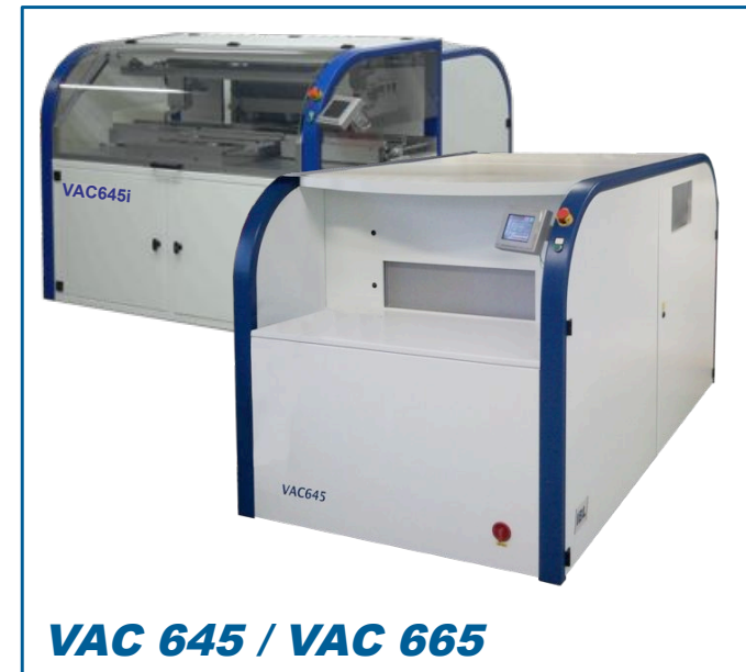
VAC 645 / VAC 665

The VAC-Series is based on the Premium-Series machines which can also be run as in-line systems. Using the additional Vacuum module the user has a combination of vapour phase and vacuum to reduce voids. Large area soldering of power electronics and lead free solder causes a higher incidence of voids and larger voids. Vapour Phase Soldering combined with vacuum minimises voids. This increases the electrical and thermal conductance, improving the function and reliability of the products. The vacuum-machine can be operated as a usual VP-Soldering Machine or with vacuum if required.